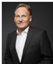
Hans-Joachim Watzke Geschäftsführer (CEO)