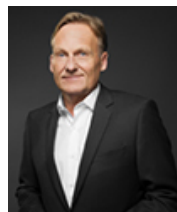
Hans-Joachim Watzke Geschäftsführer (CEO)