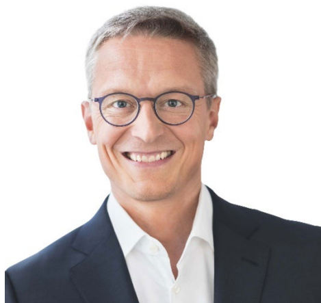
Dr. Karsten Wildberger, Vorstandsvorsitzender