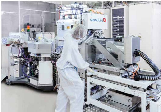
Universelle Vakuum-Beschichtungsanlage ROTARIS während der Inbetriebnahme im Reinraum in Kahl/Main

Der Auftragsbestand zum 30. Juni 2014 liegt aufgrund der noch niedrigen Auftragseingänge für Blu-ray Anlagen und den andauernden Verzögerungen bei den Auftragseingängen im Segment Solar mit 15,4 Mio. € unter dem Vorjahresvergleich mit 39,7 Mio. €. Das 1. Halbjahr 2014 schloss mit einem Ergebnis vor Zinsen und Steuern (EBIT) von -12,5 Mio. € ab (Vorjahr: -6,5 Mio. €). Das EBIT im Berichtsquartal war ebenfalls mit 7,4 Mio. € (Vorjahr: -1,6 Mio. €) negativ.