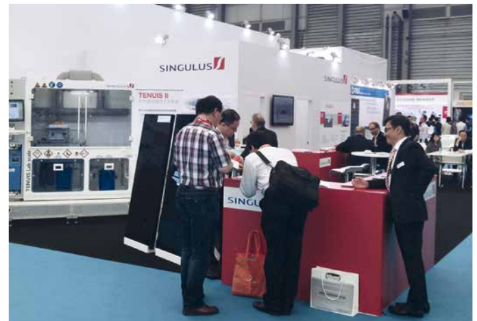
Messestand der SINGULUS TECHNOLOGIES AG auf der weltgrößten Solar-Fachmesse in Shanghai/China mit einem TENUIS Experimental System

Mit der neuen Vakuum-Beschich- tungsanlage, die nach dem Prinzip der Kathodenzerstäubung arbeitet, stärkt SINGULUS TECHNOLOGIES seine Markt- stellung als Hersteller und Entwicklungspartner für innova- tive Beschichtungstechnologien für Halbleiter-Anwendungen.