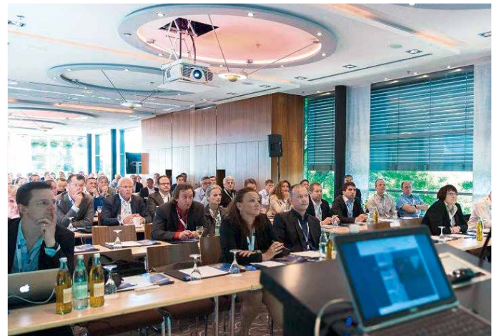
MEDIA-TECH Europe Conference in Hamburg

Nachdem SINGULUS TECHNOLOGIES in den vergangenen Jahren eine Vielzahl an Produktionsanlagen für Optical Disc verkauft hat, trägt das Servicegeschäft weiterhin einen erheblichen Anteil zu den Erträgen im Segment Optical Disc bei.