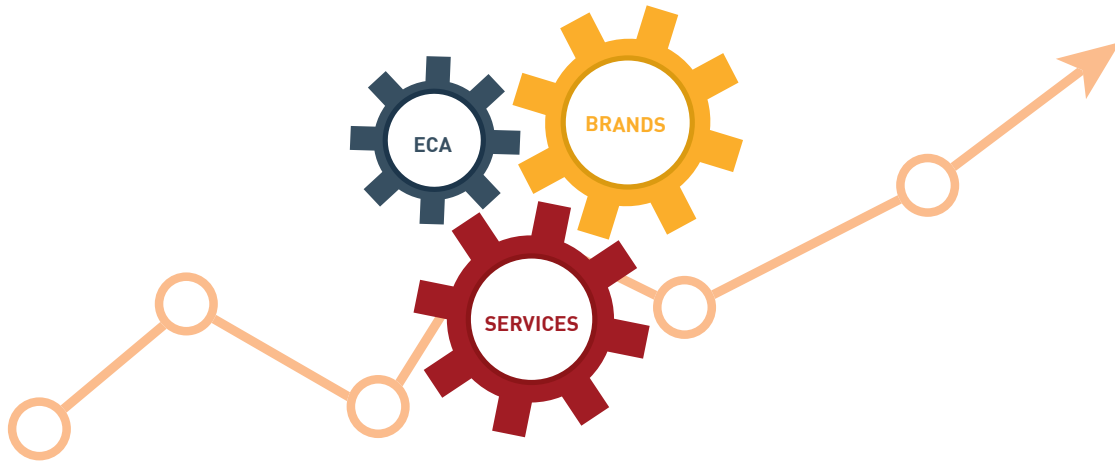
Abbildung 1 Wertschöpfungssystem Ecommerce Alliance AG

Die funktionale Expertise und nachhaltigen Erträge der Services sind feste Bestandteile des Wertschöpfungssystems der ECA und ermöglichen die Weiterentwicklung der Brands. Teil der Strategie ist es, diesen innovativen, profitablen Geschäftsbereich weiter auszubauen und durch organisches Wachstum sowie Zukäufe künftig weiter zu stärken.