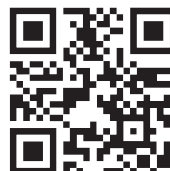
Investor Relations app download

wurden im zweiten Quartal zahlreiche Conference Calls mit Investoren geführt.