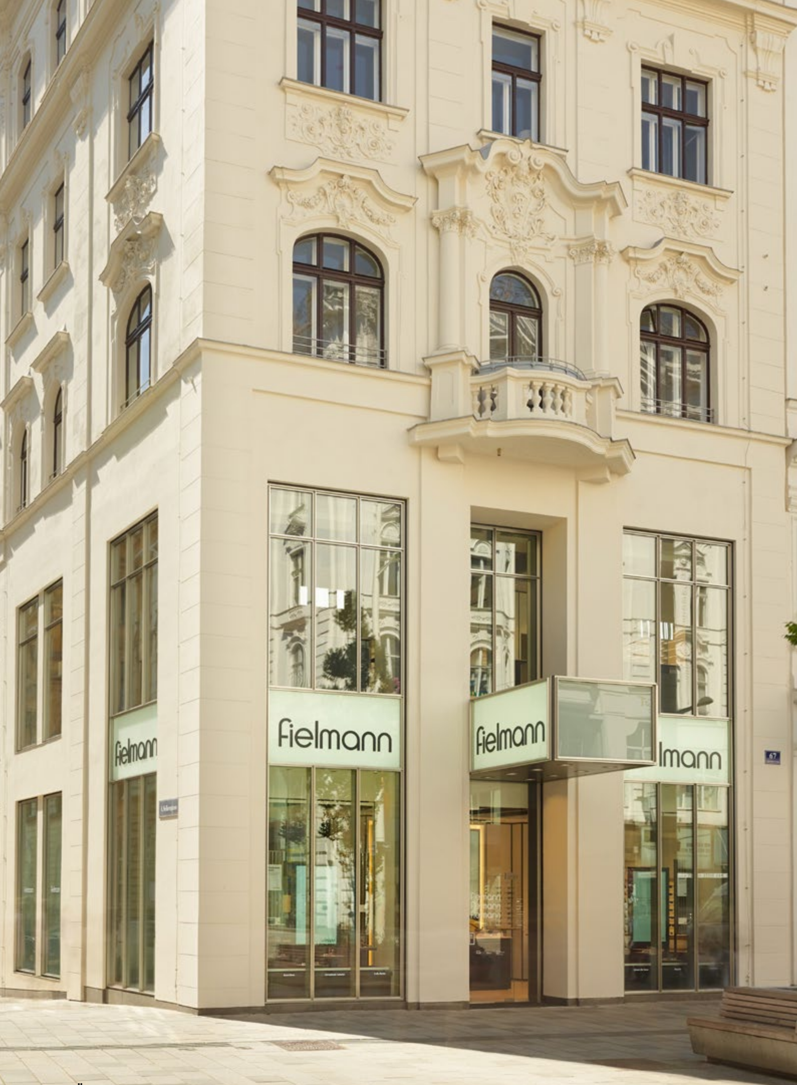
Österreich, Wien, Mariahilfer Str. 67