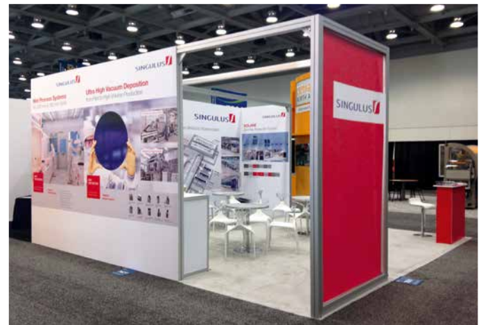
Semicon West/Intersolar North America, Juli 2014

Aufgrund der Veränderungen im Segment Optical Disc sowie der weiterhin schwierigen Situation in allen Segmenten hat SINGULUS TECHNOLOGIES eine Reihe von Maßnahmen umgesetzt, die sich zusätzlich auf die Finanzkennzahlen negativ auswirken. SINGULUS TECHNOLOGIES wird sich den geänderten Geschäftsbedingungen sowie den Marktgegebenheiten weiter anpassen. Der Vorstand hat aufgrund der Geschäftssituation umfassende Maßnahmen beschlossen. Dabei ergab die Überprüfung aller Bilanzpositionen auf ihre Wertehaltigkeit hin die Notwendigkeit, den Geschäfts- oder Firmenwert im Bereich Solar um 15,0 Mio. € abzuwerten. Für das Segment