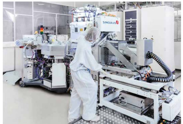
ROTARIS – Kompakte Vakuum-Beschichtungsanlage für die Halbleiterindustrie

Im Geschäftsbereich Halbleiter konzentriert SINGULUS TECHNOLOGIES weiterhin die Aktivitäten auf die Vakuum-Beschichtung von Wafern mit ultradünnen Schichten für die Herstellung von MRAM Speichern, Dünnschicht-Schreib-/Leseköpfen und für weitere Halbleiteranwendungen. Mit den Anlagenplattformen TIMARIS II und III sowie der Entwicklungsanlage ROTARIS werden potentielle Kunden in diesen Branchen angesprochen.