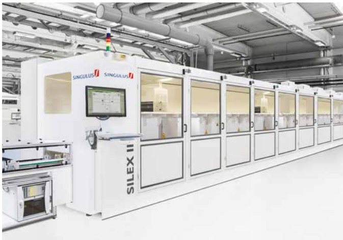
SILEX II – neues, modulares Prozesssystem für die Bearbeitung von Solarzellen

In China ist im letzten Quartal des Jahres mit einem Zubau von sieben Gigawatt zu rechnen. Dies bedeutet eine Verdoppelung gegenüber dem Vorquartal und nochmals zehn Prozent mehr als im vierten Quartal 2013. Japan und USA würden voraus-sichtlich ebenfalls noch mehrere Gigawatt Photovoltaik-Leistung bis zum Jahresende ans Netz bringen. NPD Solarbuzz geht davon aus, dass allein in diesen drei Märkten 70 % der Gesamt-nachfrage im vierten Quartal entstehen wird.