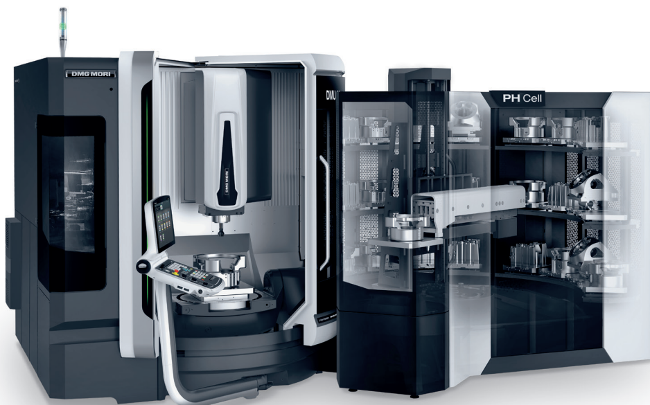
PH Cell // modularer Paletten-Rundspeicher für bis zu 40 Paletten

Erfolgreich platziert haben wir unser Kundenportal „myDMG MORI“. Es ist unser digitales Gesicht zum Kunden. Aktuell wird „myDMG MORI“ bereits von mehr als 15.000