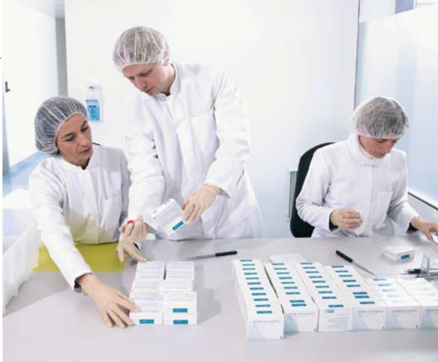
Arzneimittelkontrolle in der HAEMATO PHARM AG